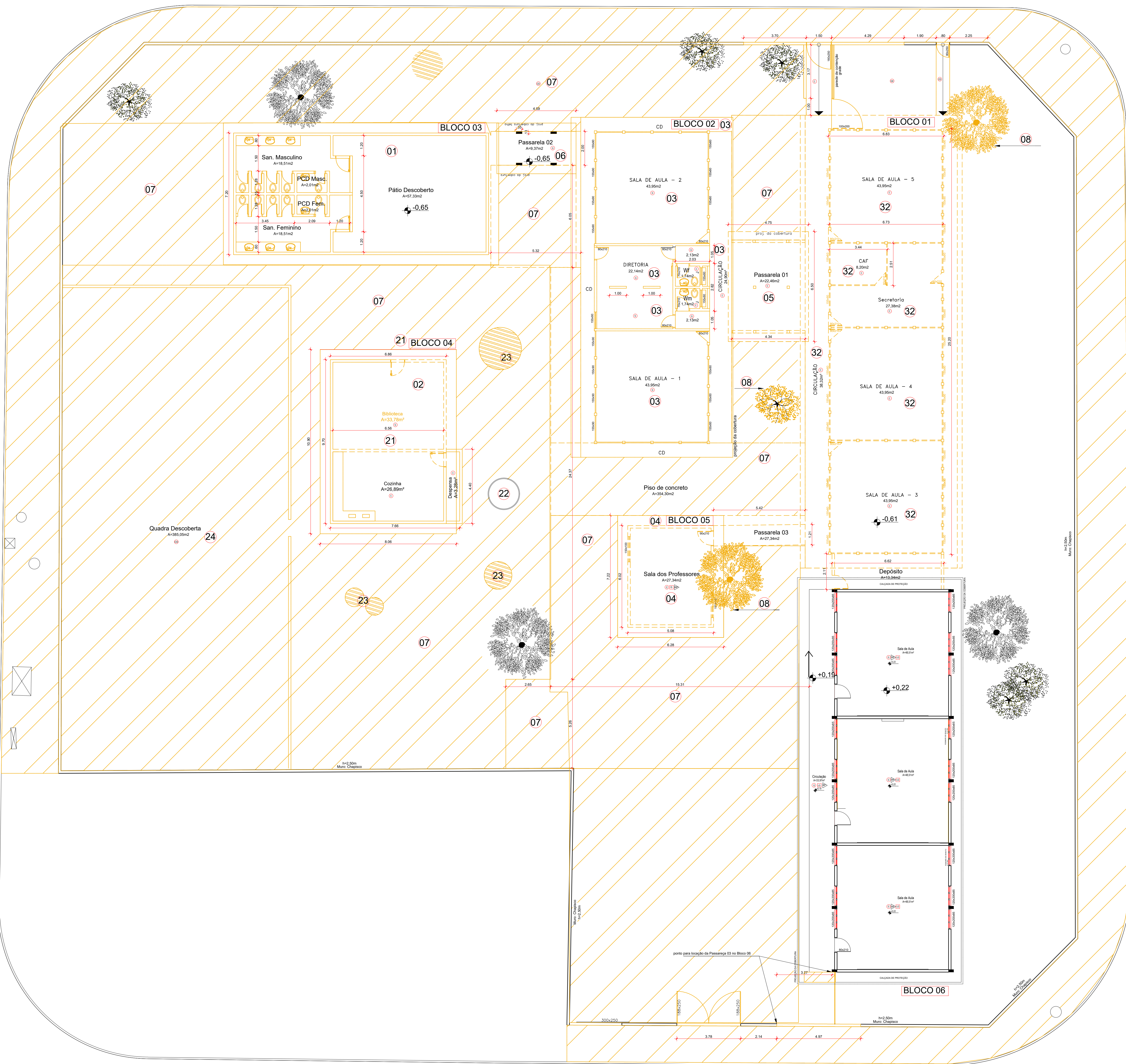
Planta Baixa - Demolição Esc.: 1:100